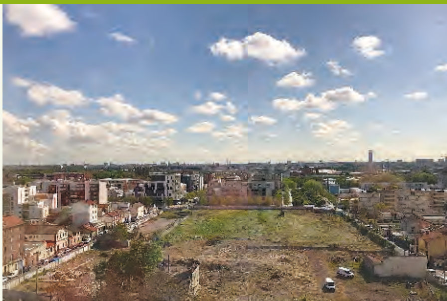
Les visites en bus de la ville débutent au 18 e étage de la mairie qui offre un panorama saisissant sur l'emprise du futur centre-ville.