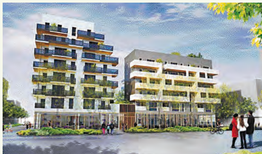
Le Lot E à Emerige (architecte : Brelan d'Arche) pour la construction de 64 logements en accession et 3 commerces.