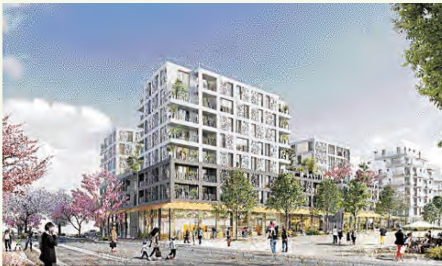
Le lot B à France Habitation (architectes Fabienne Ramery - Jean Gérin) pour la construction de 50 logements familiaux, 100 logements étudiants et 7 commerces.