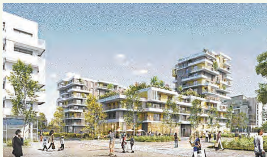
Le lot G à l'OPH (architecte : Daquin-Ferrière) pour la construction de 113 logements sociaux et 2 commerces. Les travaux sont confiés à l'Urbaine de travaux.