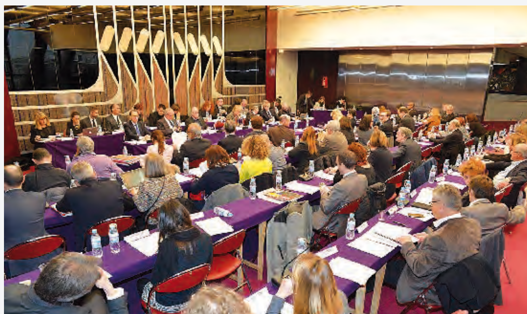
Le Territoire Boucle Nord de Seine a choisi Genevilliers pour siège. Les conseillers des sept communes qui le composent s'y réunissent régulièrement.

centrale au sein du territoire Boucle Nord de Seine, tout en restant vigilante aux éventuelles dérives intercommunales qui pourraient lui faire perdre de son autonomie au détriment des Genevillois.