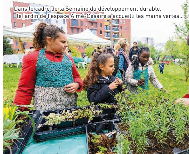
Dans le cadre de la Semaine du développement durable, le jardin de l'espace Aimé-Césaire a accueilli les mains vertes...