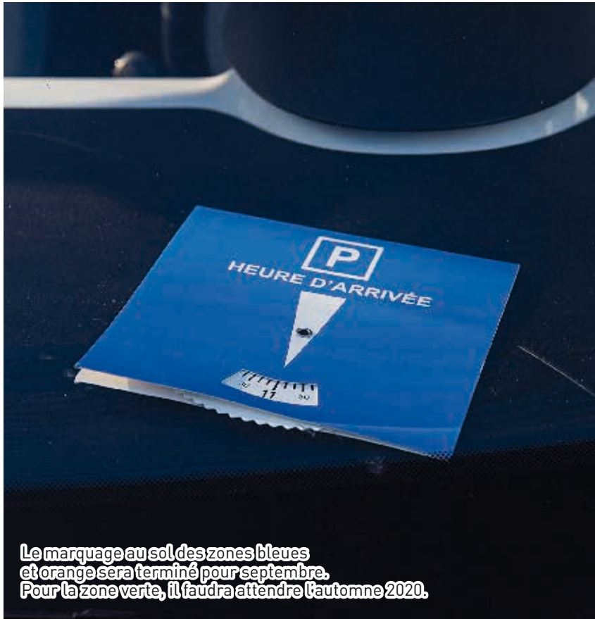
Le marquage au sol des zones bleues et orange sera terminé pour septembre. Pour la zone verte, il faudra attendre l'automne 2020.

La Ville a décidé d'étendre ses zones de stationnement réglementées. Et de distribuer un disque à chaque foyer pour pouvoir s'y garer en toute légalité.