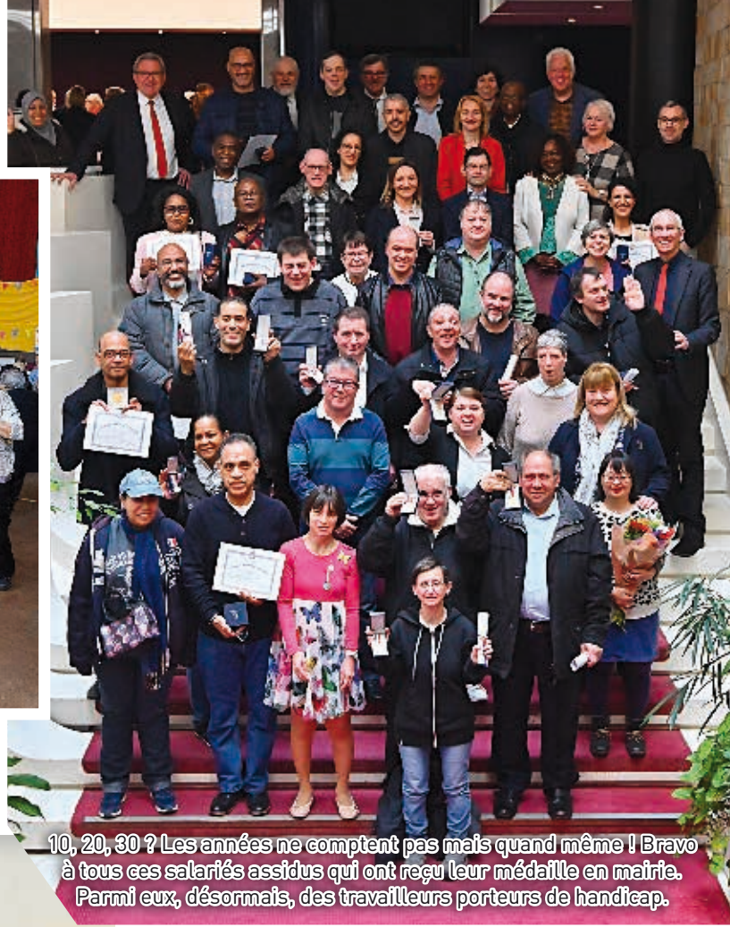
10, 20, 30 ? Les années ne comptent pas mais quand même ! Bravo à tous ces salariés assidus qui ont reçu leur médaille en mairie. Parmi eux, désormais, des travailleurs porteurs de handicap.