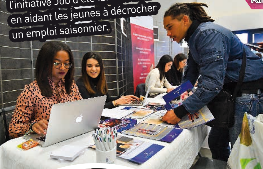
Avec 20 entreprises et 238 participants, l'initiative Job d'été fait des heureux en aidant les jeunes à décrocher un emploi saisonnier.