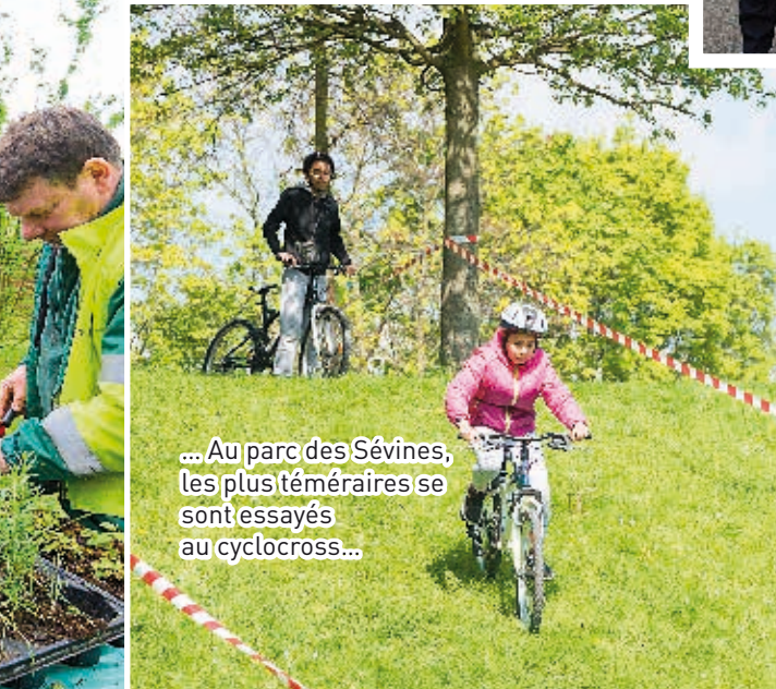
... Au parc des Sévines, les plus téméraires se sont essayés au cyclocross...