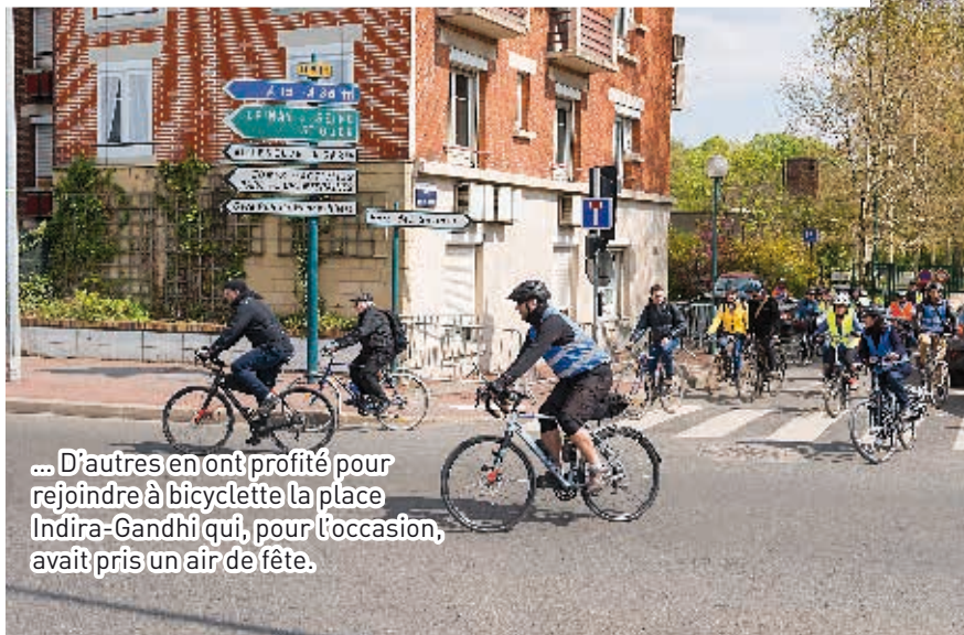
... D'autres en ont profité pour rejoindre à bicyclette la place Indira-Gandhi qui, pour l'occasion, avait pris un air de fête.