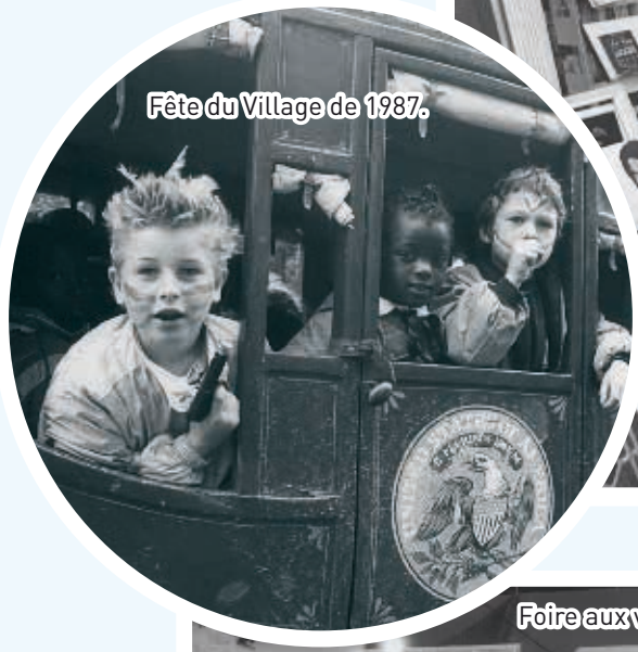
Fête du Village de 1987.