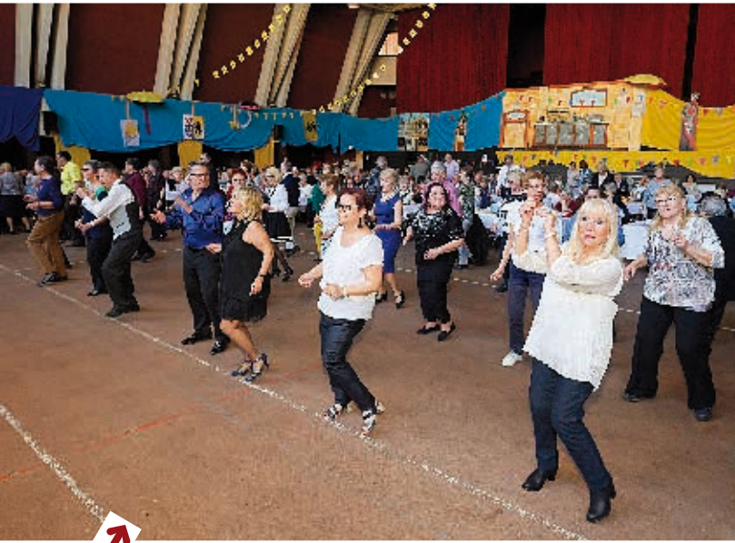
➔ Ça swingue pour les personnes de 60 ans et plus lors du banquet de printemps organisé en leur honneur.