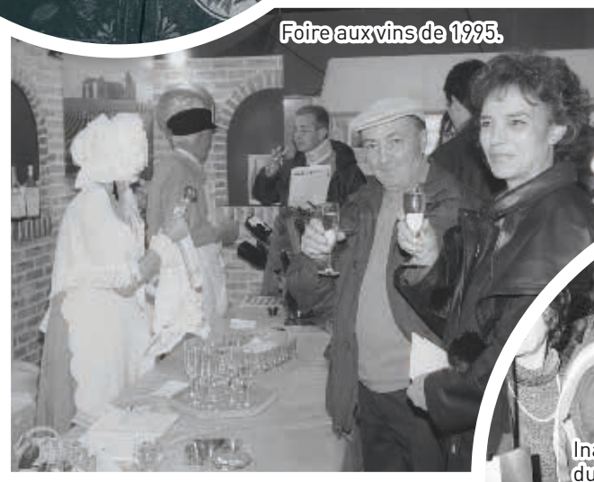
Foire aux vins de 1995.