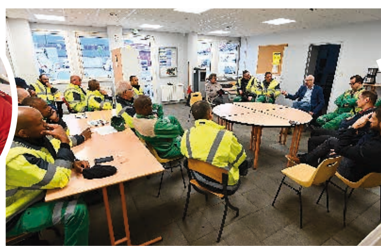
Le maire vient à la rencontre des agents du service propreté. Ici, au centre technique municipal.