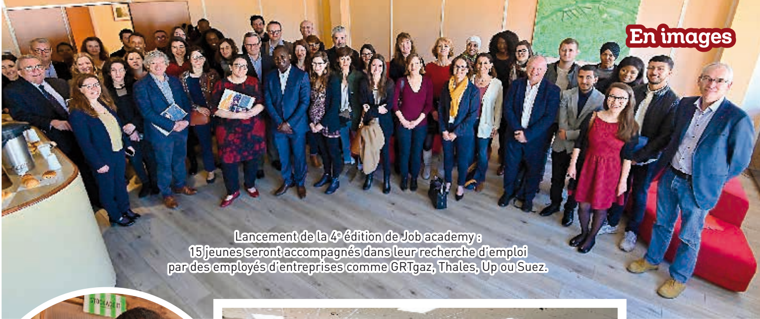
Lancement de la 4 e édition de Job academy : 15 jeunes seront accompagnés dans leur recherche d'emploi par des employés d'entreprises comme GRTgaz, Thales, Up ou Suez.