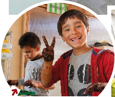
Un an déjà qu'on jardine, cuisine, recycle ou papote entre habitants à l'Agrocité... Bon anniversaire !