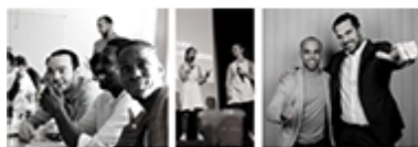
ACCÉLÉRATEUR DE RÉUSSITE Le programme incontournable pour créer, développer et booster son business

L'association Créo propose un programme d'accélération régional – coaching et formation – à destination de 120 entrepreneurs franciliens, dont au moins 40 places pour les Hauts-de-Seine.