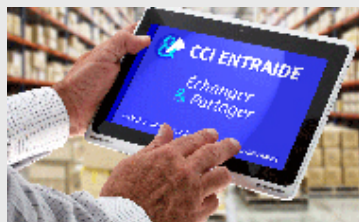
PLATE FORME D'ENTRAIDE MISE EN PLACE PAR LA CCI PARIS ÎLE DE FRANCE

La CCI Paris Île-de-France met en place une plateforme d'échanges entre entreprises, simple, rapide et gratuite, spécifique à la crise sanitaire due au Covid-19, pour faciliter solidarité et complémentarité !