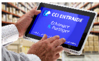
PLATE FORME D'ENTRAIDE MISE EN PLACE PAR LA CCI PARIS ILE DE FRANCE

La CCI Paris Île-de-France met en place une plateforme d'échanges entre entreprises, simple, rapide et gratuite, spécifique à la crise sanitaire due au Covid-19, pour faciliter solidarité et complémentarité !